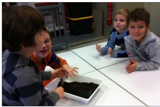
■ Planter des graines et des cailloux... pour voir si ça pousse !