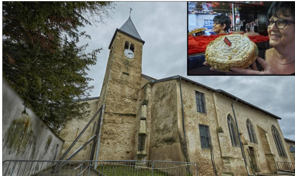
■ Sur la vente de chaque gâteau saint-georges 5 € sont reversés à la Fondation du Patrimoine.

Or, la démolition du presbytère a été dommageable pour l'équilibre de la tour. En effet, construit au XV e ou XVI e siècle, le bâtiment avait pu servir de contrefort pour la maçonnerie de la tour déjà vénérable. La disparition de l'édifice a également eu des répercussions sur le comportement du sol situé dans l'emprise de l'ancien bâtiment. Les maçonneries en-