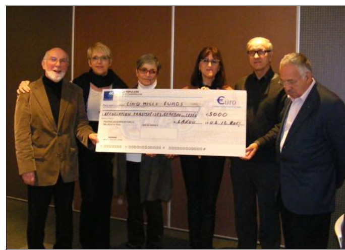
■ Les deux clubs Rotary ont remis 5000€ à l'AFTC Lorraine.