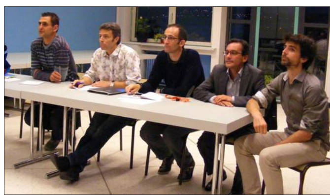
■ Une association dynamique !