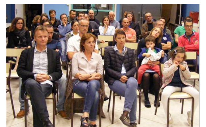
■ Un nouvel entraînement est mis en place les mercredis pour les débutants.