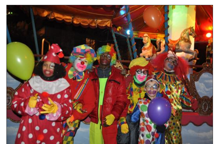
■ Les enfants de l'IME Jean-Baptiste Thiery ont amusé la galerie.

Rendez-vous au Champ-le-Bœuf vendredi, le départ sera donné de la MAS à 18 h !