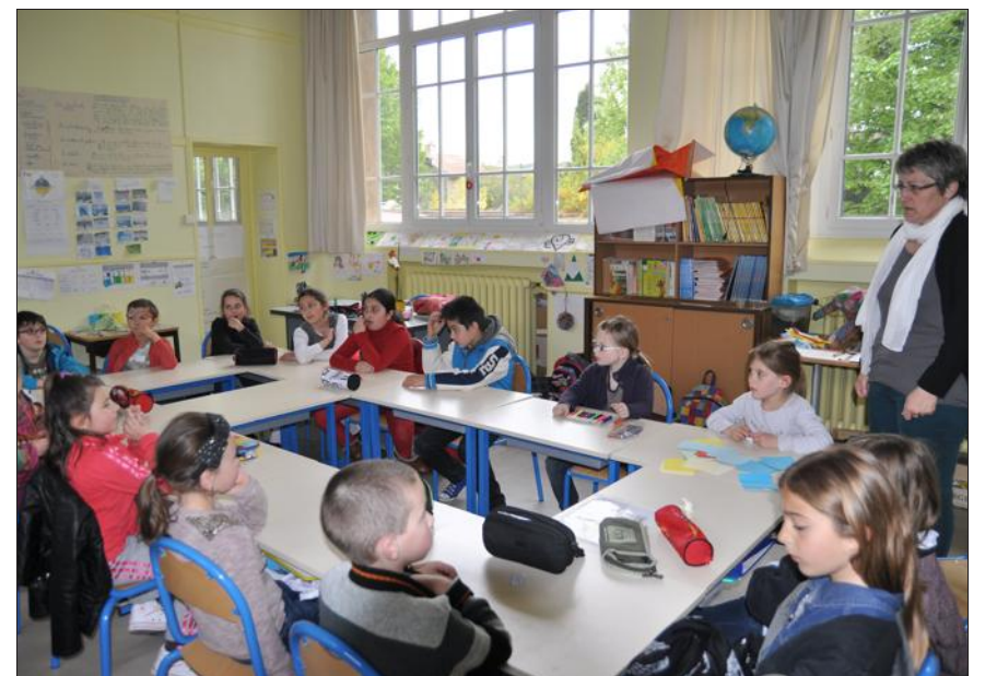
■ Les parents seront prochainement invités pour l'exposition des créations.

trés) et des choses plus surprenantes que les enfants ont dû apprécier : une préparation de douceurs réemballées avec des vers poétiques et une distribution de papillons sur les pare-brise de la rue, des sortes de contraventions poétiques que le plus indiscipliné des automobilistes rêverait de recevoir !