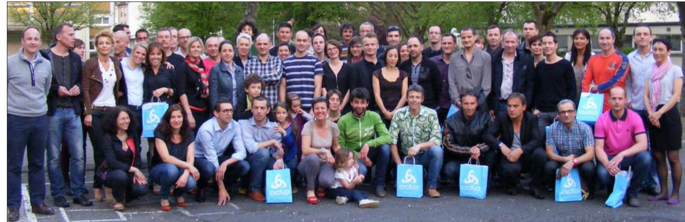
■ Le club a remis des maillots à ses adhérents.

Le WTL organise son grand rendez-vous annuel à la Sapinière, le Laxou Trail, le 21 mai. Le président a profité de l'occasion pour faire un appel aux bénévoles. D'autre part, la date du 29 juin a été retenue pour le traditionnel barbecue de fin d'année.