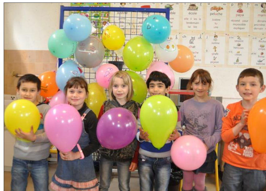
■ La journée poétique se voulait ludique et récréative.

Belle ferveur, une nouvelle fois, avant les vacances à l'école élémentaire Vautrin. La journée autour de la poésie, organisée à l'occasion du Printemps des Poètes, a permis d'aborder différemment les apprentissages (arts visuels, écriture...). Et, surtout, de marquer l'événement d'une manière originale, en donnant un ca-