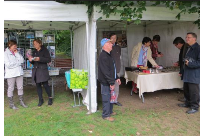
■ Vingt-quatre associations ont participé au forum.

L'association « Les Amis de Thilogne » organise son 2 e vide-greniers en salle, le lundi 11 novembre, au complexe Léo-Lagrangé à Champ-le-Bœuf. Inscriptions, tél. 06.70.45.23.48.