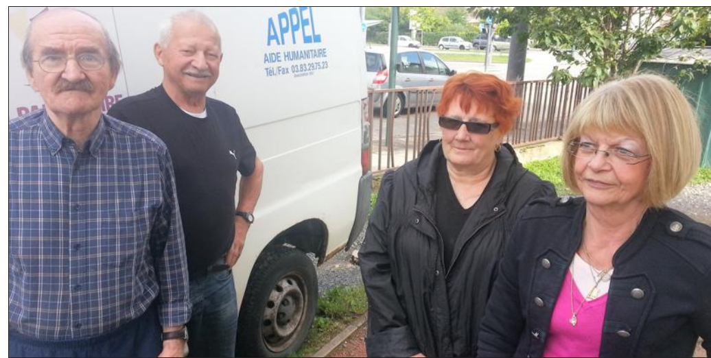
■ L'équipe d'Appel s'appête à rejoindre « La maison du Grémillon ».

On approche du 20 e anniversaire d'Appel ; l'association soufflera ses vingt bougies en octobre.