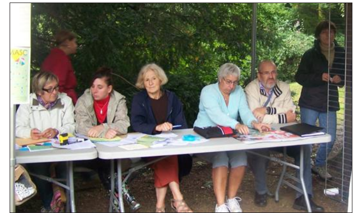
■ Trois nouvelles propositions cette année.

Samedi, l'association Masc a commencé sa saison. Elle a connu une bonne reprise pour les activités sportives (le judo, la natation, le basket, le badminton, le tennis de table, la gymnastique volontaire, l'aïkido, le taïso) et les activités culturelles (yoga, danse moderne, guitare, accordéon, vielle, violon, informatique, couture, marionnettes, peinture sur porcelaine, poterie, modelage, théâtre.)